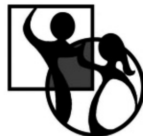
The New Square Dance Logo

3月21日(月)でまん延防止等重点措置が解除されました。しかし、新型コロナウイルス感染が収束したわけではありません。今まで行ってきた感染防止対策はまだまだ続けなくてはなりません。4月に入りだいぶ温かくなってきましたが、まだまだ三寒四温の候、オミクロン株への感染防止対策とともに、ご自愛をお願い致します。