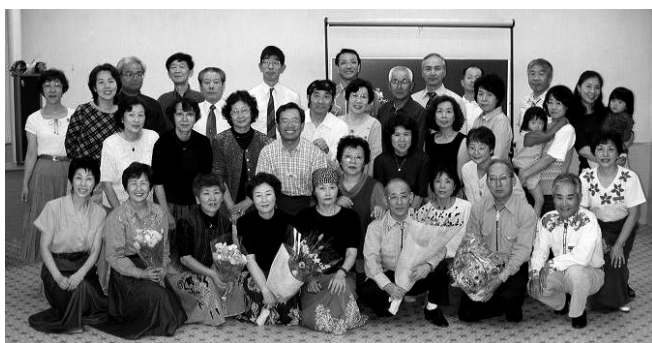
創立例会には多くの仲間が参加してくださいました