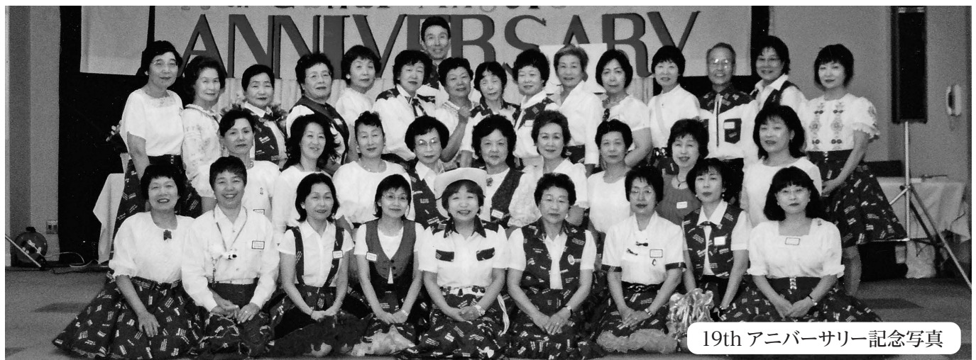
19th アニバーサリー記念写真